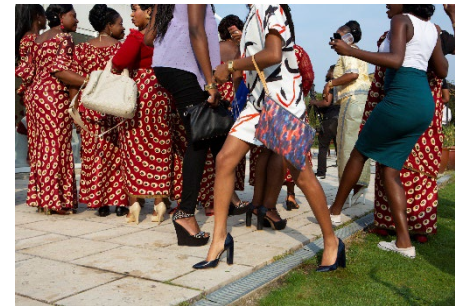
3 © Carolina Arantes