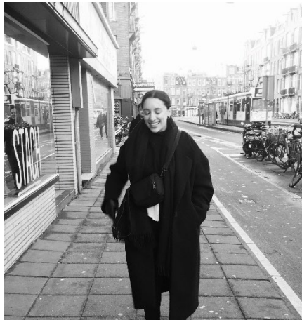
1 Porträt

„The hooded man at the computer: What are cyber images telling us?“