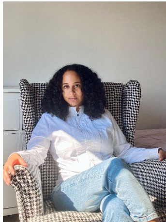
1 Porträt