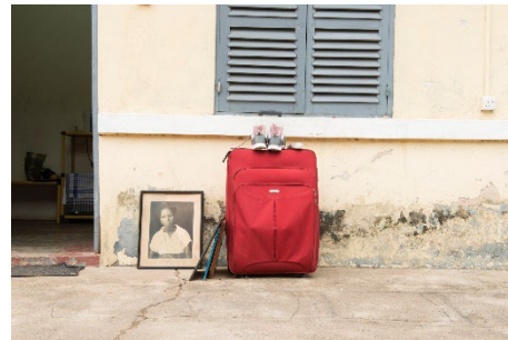
2 © Dzifa Peters