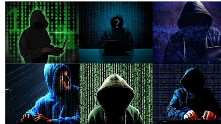
2 © Esther Gabrielle Kersley