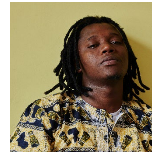
4 © Dzifa Peters