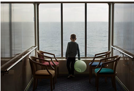
© Andrea Gjestvang, Ein kleiner Junge schaut aus dem Fenster, 2017

2_ Eine Tischlerwerkstatt in der Hauptstadt Tórshavn.