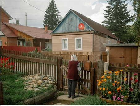
© Aliona Kardash, Die Großmutter steht vor dem Haus meiner Eltern, 2023

3_ Die Großmutter steht vor dem Haus ihrer Eltern. Sie ist 94 Jahre alt, hat ihr ganzes Leben in einem kleinen Dorf verbracht und ist vor sechs Jahren in eine Einzimmerwohnung in Tomsk gezogen. Die Großmutter liebt ihr neues Zuhause, aber dieser Ort erinnert sie an die Vergangenheit, die sie vermisst. 02.09.23