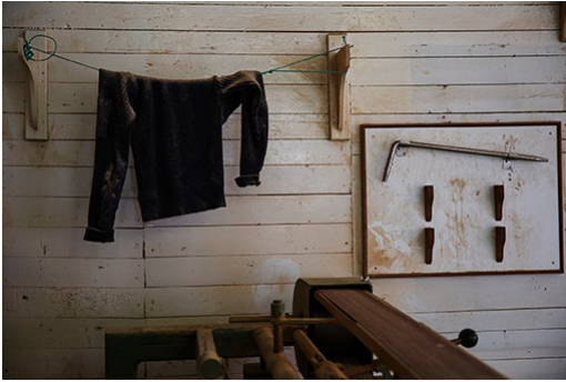
Eine Tischlerwerkstatt in der Hauptstadt Tórshavn, 2016

2_ Eine Tischlerwerkstatt in der Hauptstadt Tórshavn.