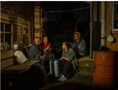
© Aliona Kardash, Ein Porträt von mir, meinen Eltern und meiner Oma auf der Hausterrasse, 2023

3_ Die Großmutter steht vor dem Haus ihrer Eltern. Sie ist 94 Jahre alt, hat ihr ganzes Leben in einem kleinen Dorf verbracht und ist vor sechs Jahren in eine Einzimmerwohnung in Tomsk gezogen. Die Großmutter liebt ihr neues Zuhause, aber dieser Ort erinnert sie an die Vergangenheit, die sie vermisst. 02.09.23