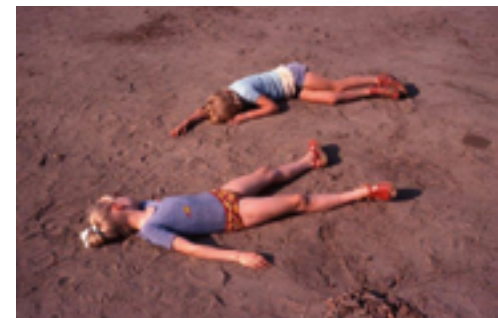
Seuchenopfer Rhön, Setfoto zum Film Die Hamburger Krankheit

Sie erzählen Geschichten und geben als Zeitzeugen Einblick in die jüngere Vergangenheit der Stadt und unserer Gesellschaft. Damit spiegeln sie den Wandel Fuldas und seiner Bewohner wider. Manchmal sind Momente des Innehaltens eingefangen, manchmal klare Aussagen mit heftigen Emotionen verbunden. Gestellt ist hier das Wenigste – die Fotografen waren zur richtigen Zeit am richtigen Ort. In allen Fällen sind die persönliche künstlerische Handschrift und die Motivation der Fotografen zu erkennen.