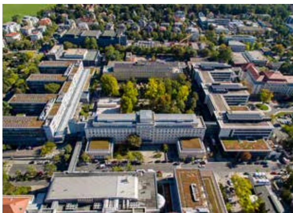
Universitätsklinikum Carl Gustav Carus

anschließend gemeinsames Essen mit den Referenten Schiller Garten Schillerplatz 9, 01309 Dresden