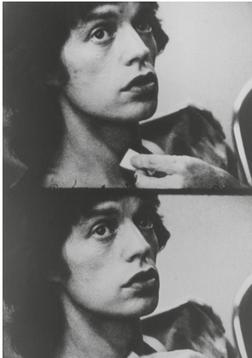
Still aus / from Cocksucker Blues, directed by Robert Frank, 1972