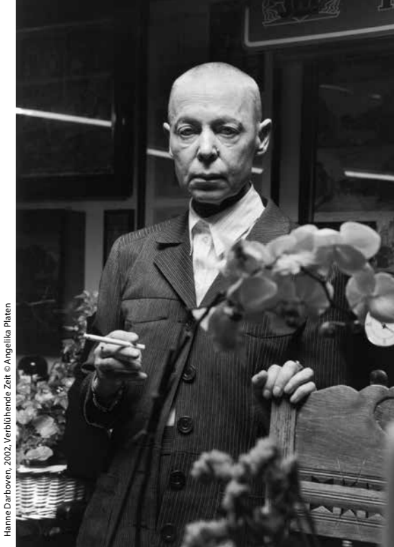
Hanne Darboven, 2002, Verblühende Zeit

Gern begrüßt Sie der Freundeskreis der LUDWIGGALERIE Schloss Oberhausen zu einem erfrischenden Getränk bei anregenden Gesprächen. Bitte beachten Sie, dass nur eine begrenzte Anzahl von Sitzmöglichkeiten zur Verfügung steht! Der Eintritt ist frei.