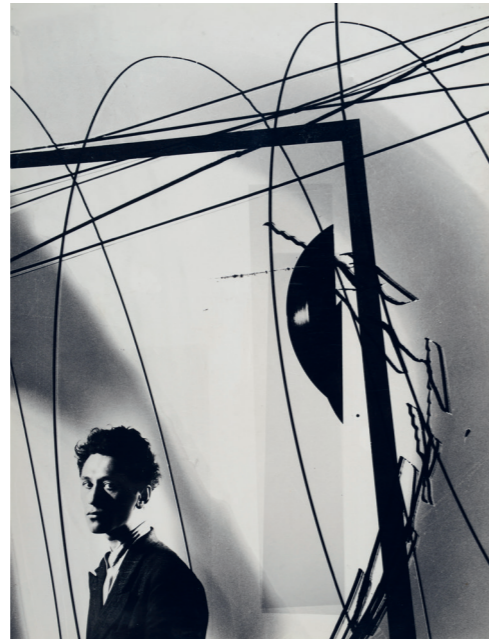
1) Selbstporträt, 1953, Kopiermontage mit Negativ-Chemigravik, 40x30 cm

Breier war Professor für Fotografie an der Hochschule für bildende Künste Hamburg. Sein Werk ist von einem innovativen Umgang mit der Fotografie gekennzeichnet, der mit den Ideen der Konkreten Kunst und Zero korrespondiert. Er suchte im Experiment den »Nullpunkt« der Bildgestaltung zu erreichen. Aus ersten von Strukturen und Kontrasten sowie Licht- und Schattenverläufen bestimmten Aufnahmen entwickelte er kameralose und autonome Bilder mittels Fotocollage, Fotogramm, Negativbearbeitung oder fotochemischer Verfahren.