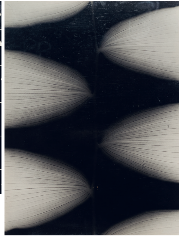
4) Ohne Titel (Pflanze), 1957, Fotogramm auf Silbergelatinepapier, 22,5x17,5 cm

Kilian Breier (1931-2011) is regarded as one of the most important experimental German photographic artists of the postwar period. The exhibition at the Alfred Ehrhardt Stiftung presents an outstanding collection of Breier's works, highlighting his developmental process from representational form to abstraction. The selected works offer a glimpse into the artist's fascinating imagery, created between the 1950s and 1980s, which are based on natural materials such as plants or trees.