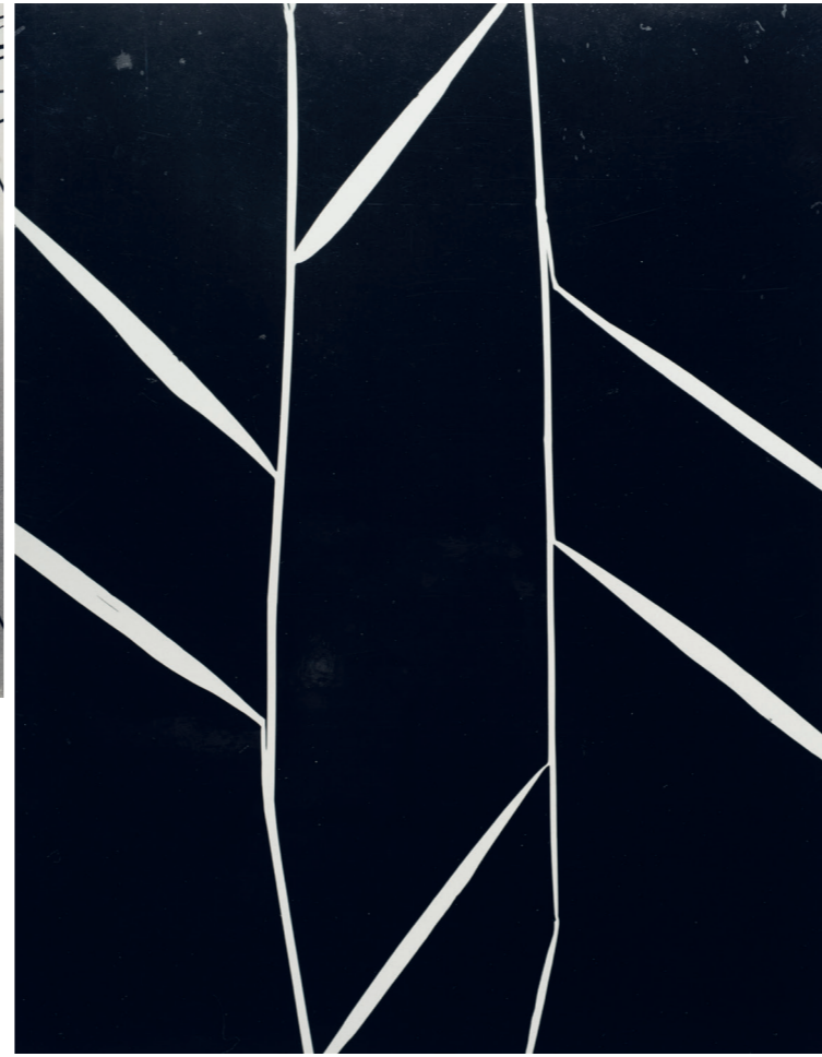
2) Ohne Titel (Gräser), 1957, Fotogramm auf Silbergelatinepapier, 40x28,5 cm