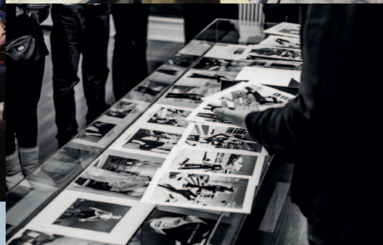
BESUCH DER HELMUT NEWTON FOUNDATION BERLIN