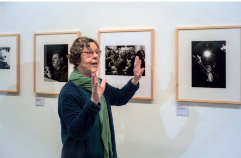
BARBARA KLEMM

Die DGPh setzt sich intensiv für die Belange der Fotografie und der Fotografen ein. Deshalb halte ich die DGPh für sehr wichtig.