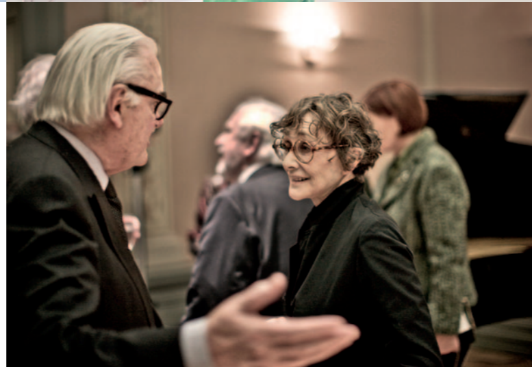
F.C. GUNDLACH MIT SARAH MOON