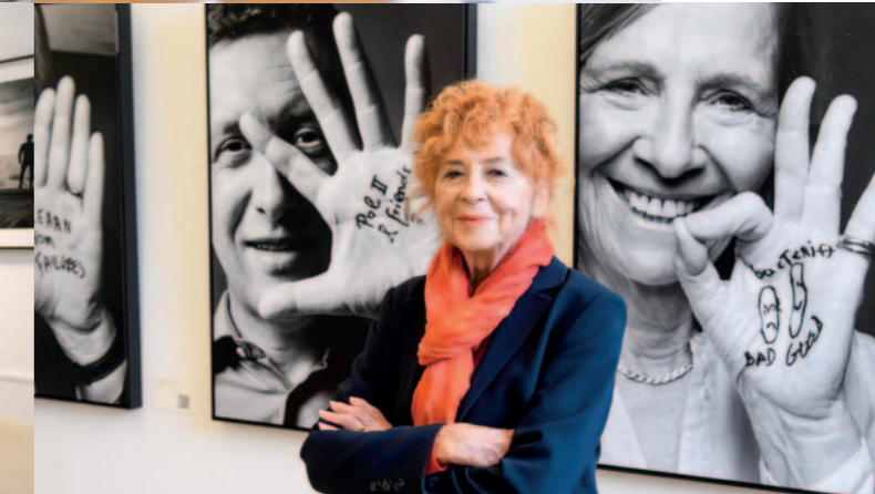
HERLINDE KOELBL

Fotografie ist so viel mehr als das Festhalten eines Moments.