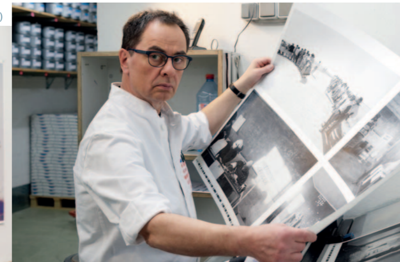
GERHARD STEIDL

Die DGPh leistet gerade in der heutigen Zeit einen wertvollen Beitrag für die deutsche Fotografie, denn sie fördert mit ihren Preisen und Stipendien Fotografie jenseits kommerzieller und schnelllebiger Interessen.