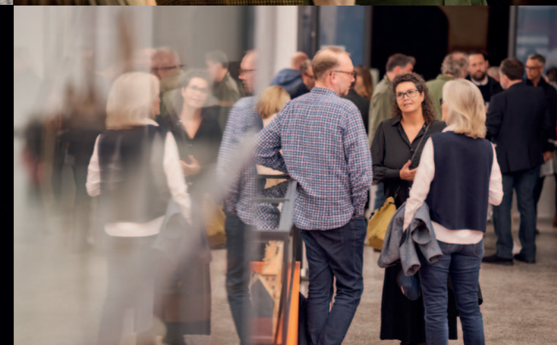
DR. ERICH SALOMON-PREISVERLEIHUNG 2021, HAMBURG