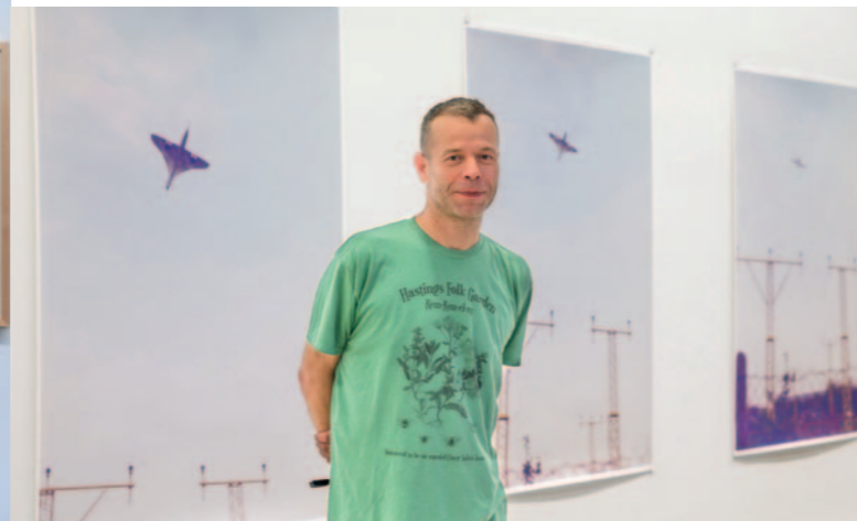
WOLFGANG TILLMANS

Die Fotografie, ein Medium des Wandels, befindet sich heute an einem historisch und kulturell einschneidenden Wendepunkt. Die Möglichkeiten und Wirklichkeiten von KI fordern das Bildermachen auf besondere Weise heraus. Deshalb ist die Arbeit von Organisationen wie der Deutschen Gesellschaft für Photographie besonders wichtig.